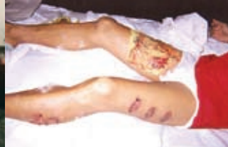
Bewerkt met een gloeiende pook