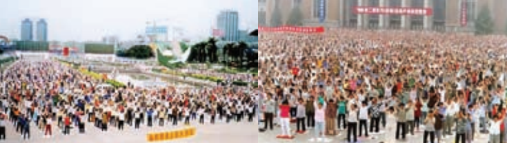
Falun Gong oefenplaatsen in Guangzhou en Chongyang, vóór de vervolging.