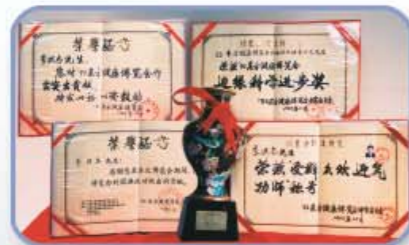
boven: Oorkondes uitgereikt aan Meester Li Hongzhi van de Oosterse Gezondheidsexpo in Peking - december 1993.

Gedurende deze jaren steunde de Chinese overheid Falun Gong actief. Er werd vastgesteld dat het significant positieve effecten op de gezondheid heeft, terwijl het ook nog eens het karakter en de moraliteit verbetert.