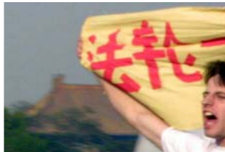
Westerse beoefenaar wordt gearresteerd op het Plein van de Hemelse Vrede

Toen leerde ik over de vervolging van Falun Dafa in China. Ik was uitermate geschokeerd! Mensen sterven omdat ze dit doen? Omdat ze de leringen van Waarachtigheid, Mededogen en Verdraagzaamheid volgen, net als ik doe? Dat is onmogelijk. Maar toen ik elke dag www.faluninfo.net begon te lezen, om te zien of het beter ging, bleef het dodental stijgen. Nu zijn er honderden gedocumenteerde gevallen van Falun Gong beoefenaars in China die gestorven zijn in politiebewaring. Toen ik hun verhalen begon te lezen, voelde ik me ofwel ziek in mijn maag of moest ik huilen. Naakte vrouwen werden in cellen met mannelijke gevangenen geïnterviewd om verkracht te worden, mannen die door de straten gesleept werden achter een auto totdat ze volledig verminkt waren om vervolgens in brand gestoken te worden, vrouwen die met elektrische stokken geschokt werden aan hun genitaliën totdat hun huid blauw zag, mensen die van hun eigen flatgebouw gegooid werden en stierven tengevolge van de val, en zowel jongeren als oude mensen die doodgemarteld werden. Elk sterfgeval is door de Chinese autoriteiten gerapporteerd als of “dood door natuurlijke oorzaak” of “zelfmoord”. Tienduizenden beoefenaars zijn in werkkampen geplaatst of gevangengenomen zonder proces, hebben hun banen en thuis verloren, hun families zijn verscheurd, en zijn zelfs gedwongen opgenomen in psychiatrische inrichtingen waar hen zenuwaantastende medicijnen zijn toegediend.