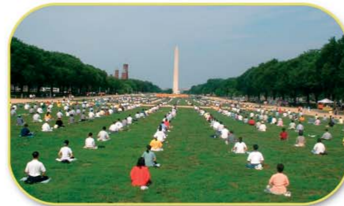
Groepsoefening, Washington D.C.

Na de succesvolle introductie in China, bezocht Meester Li ook andere landen om Falun Gong te verspreiden. Hij gaf lezingen in o.a. Parijs, Frankfurt, New York en San Francisco.