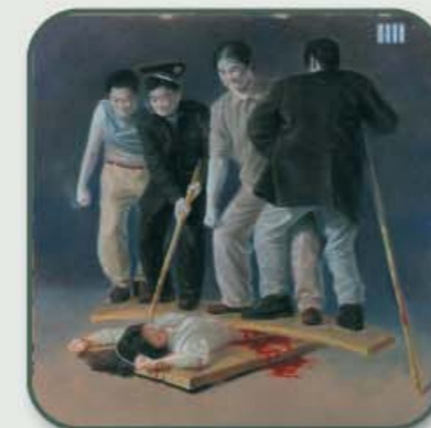
marteltechniek: met een scherp bamboestokje worden de vingers en nagels doorgestoken