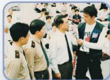
Televisie interview met beoefenaars tijdens ochtend groepsoefening.

In korte tijd verspreidde Falun Gong zich zonder commerciële promotie over heel China. In de parken en op de pleinen in vrijwel alle grote steden in China kon men mensen Falun Gong zien oefenen.