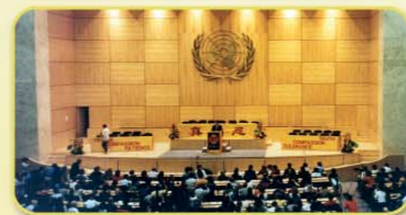
Tijdens de Falun Gong conferentie in Geneva 1998, wisselden beoefenaars onderling ervaringen uit.