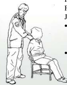
marteltechniek: het hoofd van het slachtoffer wordt met een zak afgebonden

Meer dan 100 verschillende, meedogenloze marteltechnieken zijn toegepast.