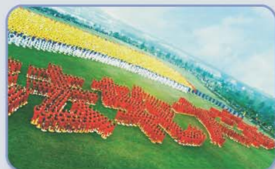
Beoefenaars vormen de Chinese karakters voor "Falun Dafa" in Leshan, centraal China.

In korte tijd verspreidde Falun Gong zich zonder commerciële promotie over heel China. In de parken en op de pleinen in vrijwel alle grote steden in China kon men mensen Falun Gong zien oefenen.