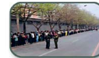
10,000 beoefenaars protesteren in Peking

Met de toenemende populariteit, nam ook de jaloezie toe bij bepaalde functionarissen binnen de hoogste gelederen van de Communistische Partij, met name bij Jiang Zemin. De incidenten tegen Falun Gong namen langzaam toe met een climax in mei 1999, toen 10.000 Falun Gong beoefenaars protesteerden tegen hun onrechtvaardige behandeling. Korte tijd later kondigde Jiang Zemin de ban op Falun Gong af.