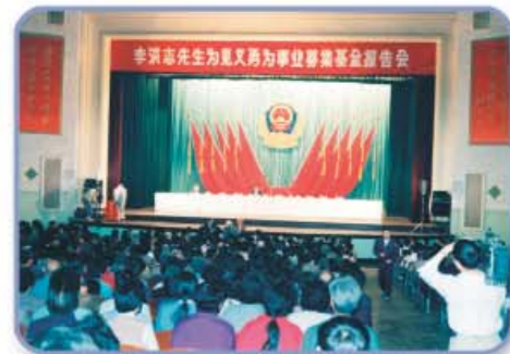
Meester Li geeft een lezing in Peking - 1993.

Gedurende deze jaren steunde de Chinese overheid Falun Gong actief. Er werd vastgesteld dat het significant positieve effecten op de gezondheid heeft, terwijl het ook nog eens het karakter en de moraliteit verbetert.